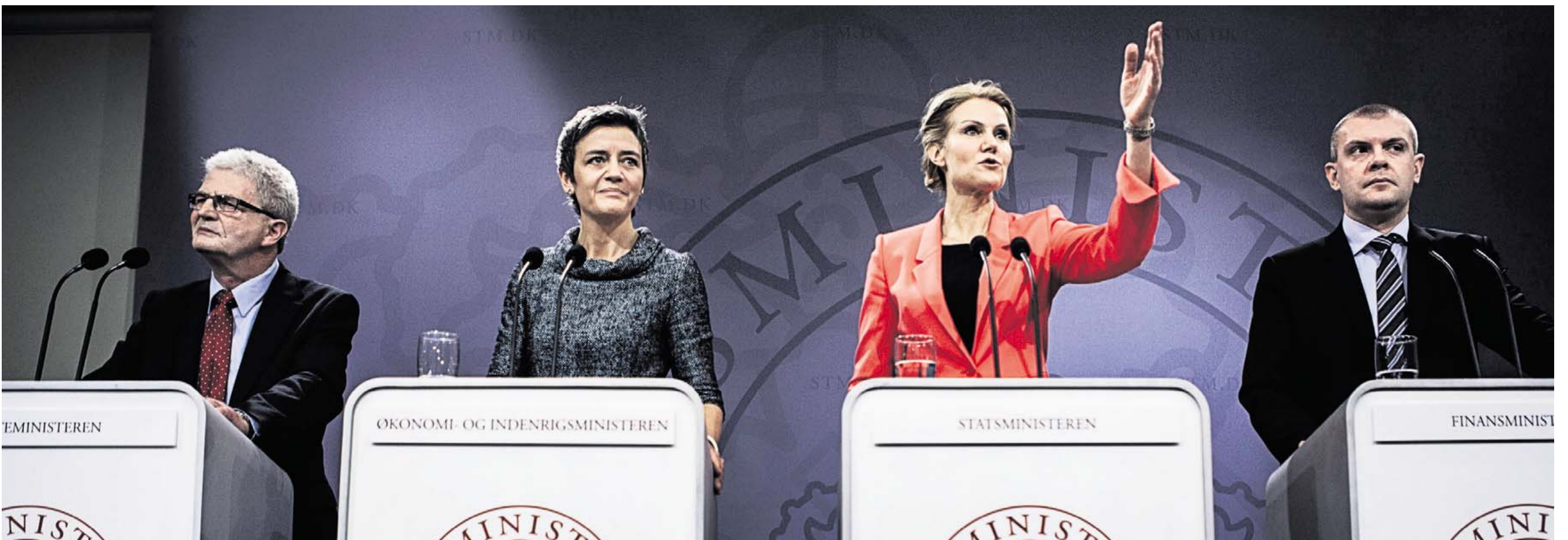
SNILDE. Regeringen er paradoksalt nok blevet trængt i defensiven af sin egen reformoffensiv. Den har nemlig valgt at lave reformer på områder, som berører store vælgergrupper. Det viser, at reformer skal vælges med større snilde.